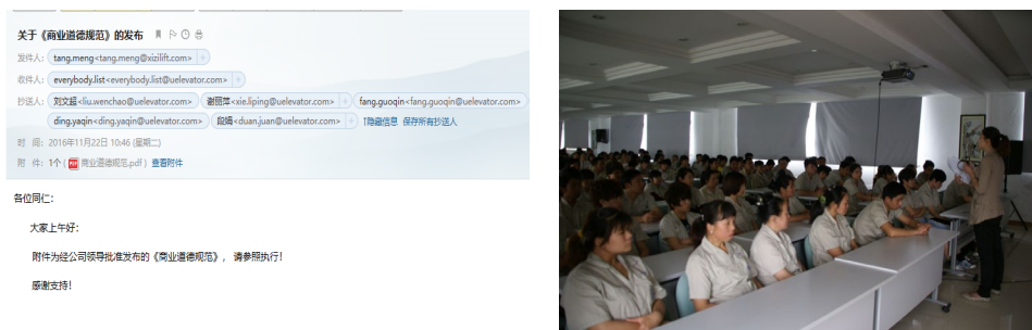
图表 3：公司践行诚信守法教育活动示例

公司还结合各相关方的利益需求，采用自查、社会公众及其他相关方监督、第三方测量相结合的方法，量化绩效指标，全面评价并促进组织内部及与顾客、供方和合作伙伴之间、公司治理中的诚信和道德行为，确保合同双方权益不受损害等。